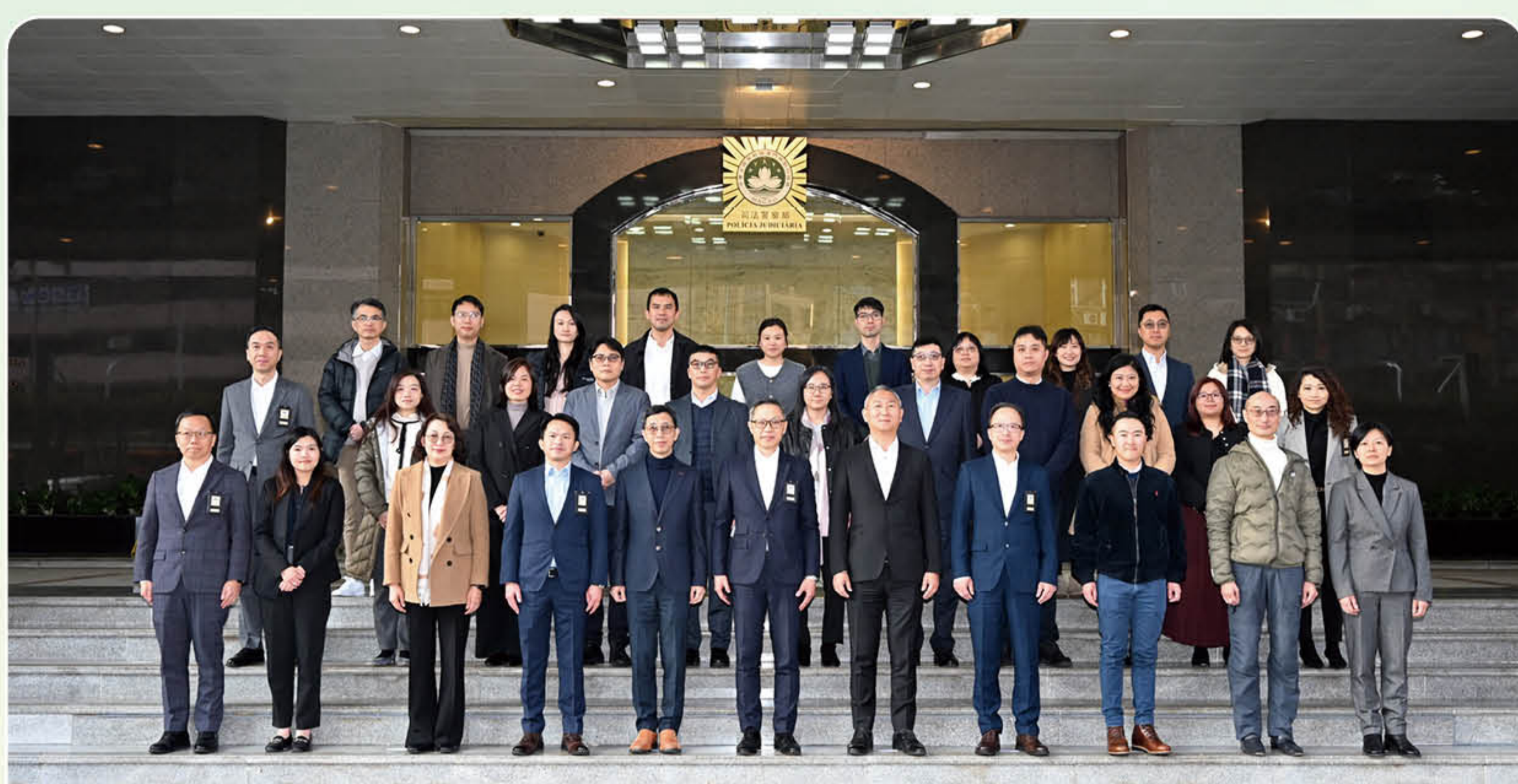
禁毒委員會工作小組成員與司法警察局領導人員合照

代表團於到訪期間參觀了司法警察局刑事技術廳、反詐騙協調中心、網絡安全事故預警及應急中心，了解司法警察局近年在物證檢驗鑑定，尤其對毒品和毒物的分析，以及透過科技應用與數據化手段應對電訊網路詐騙等工作。交流活動有助共同推動預防毒品犯罪及防治濫藥等方面的宣傳教育工作，共建安全、健康的社會環境。