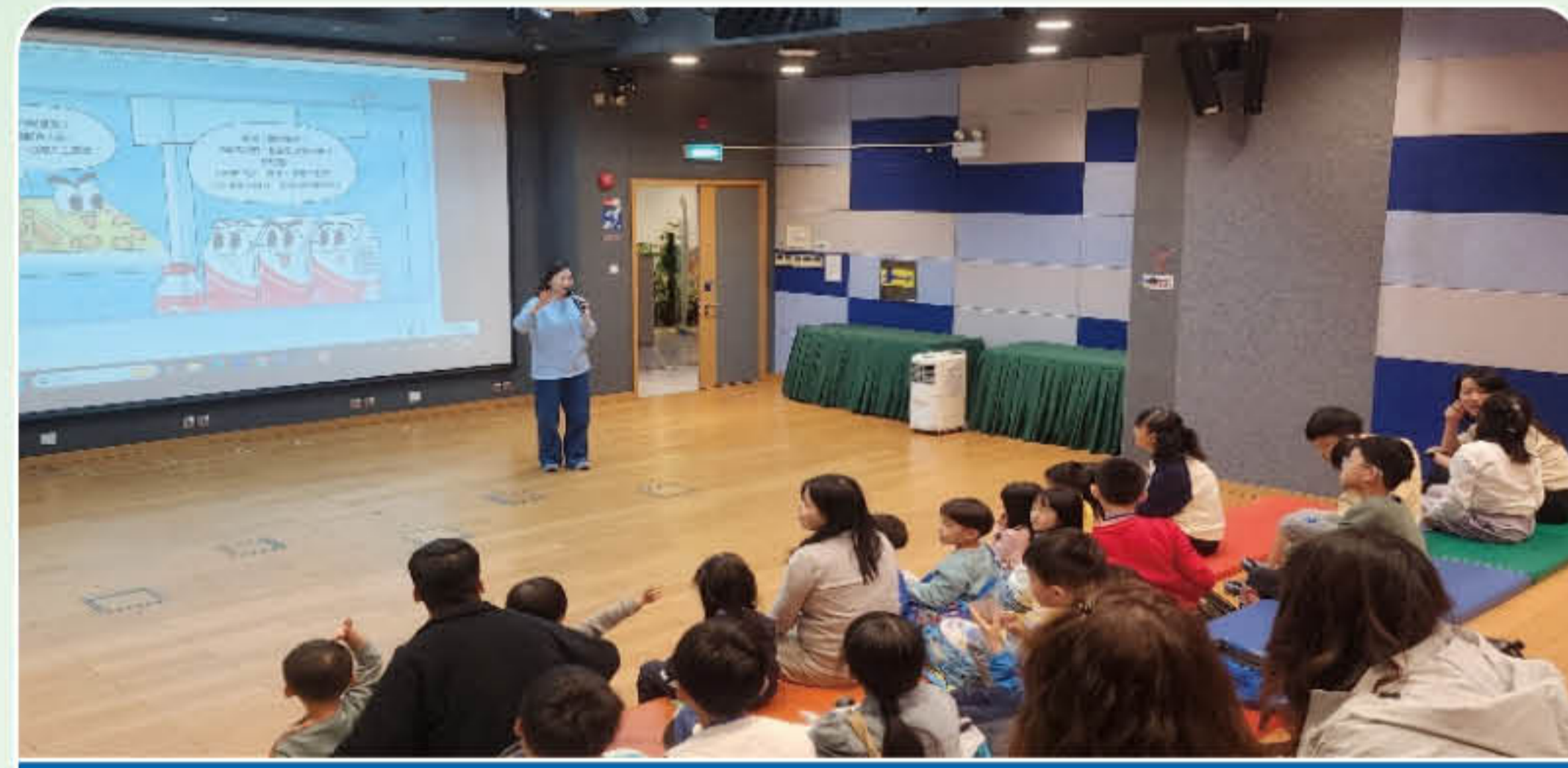
導師引導親子共讀繪本故事 《衣櫃的魔法》