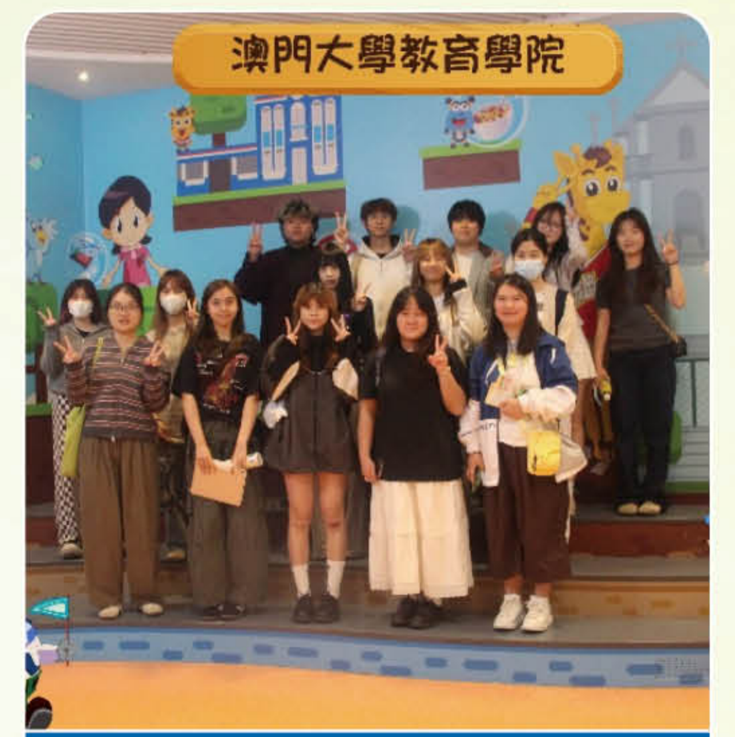
學前教育專業學生合照