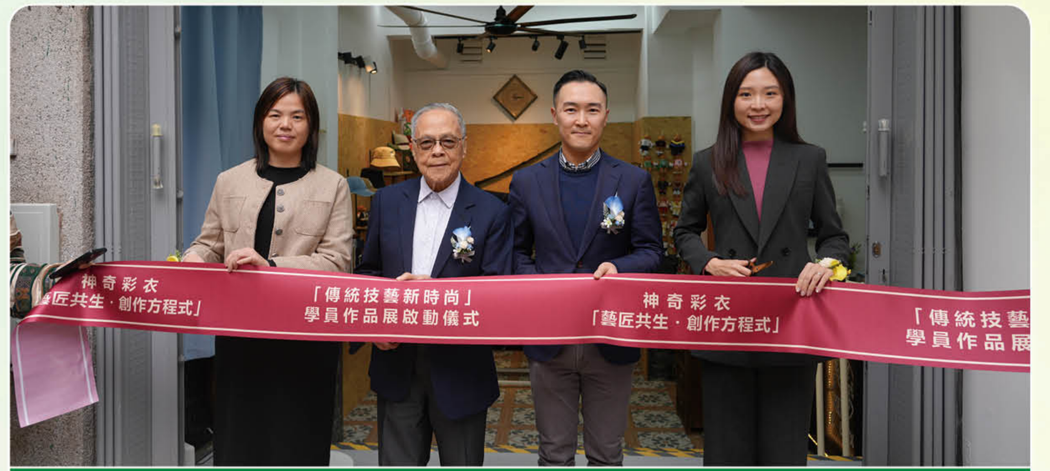
茨林圍「傳統技藝新時尚」學員作品展啟動儀式