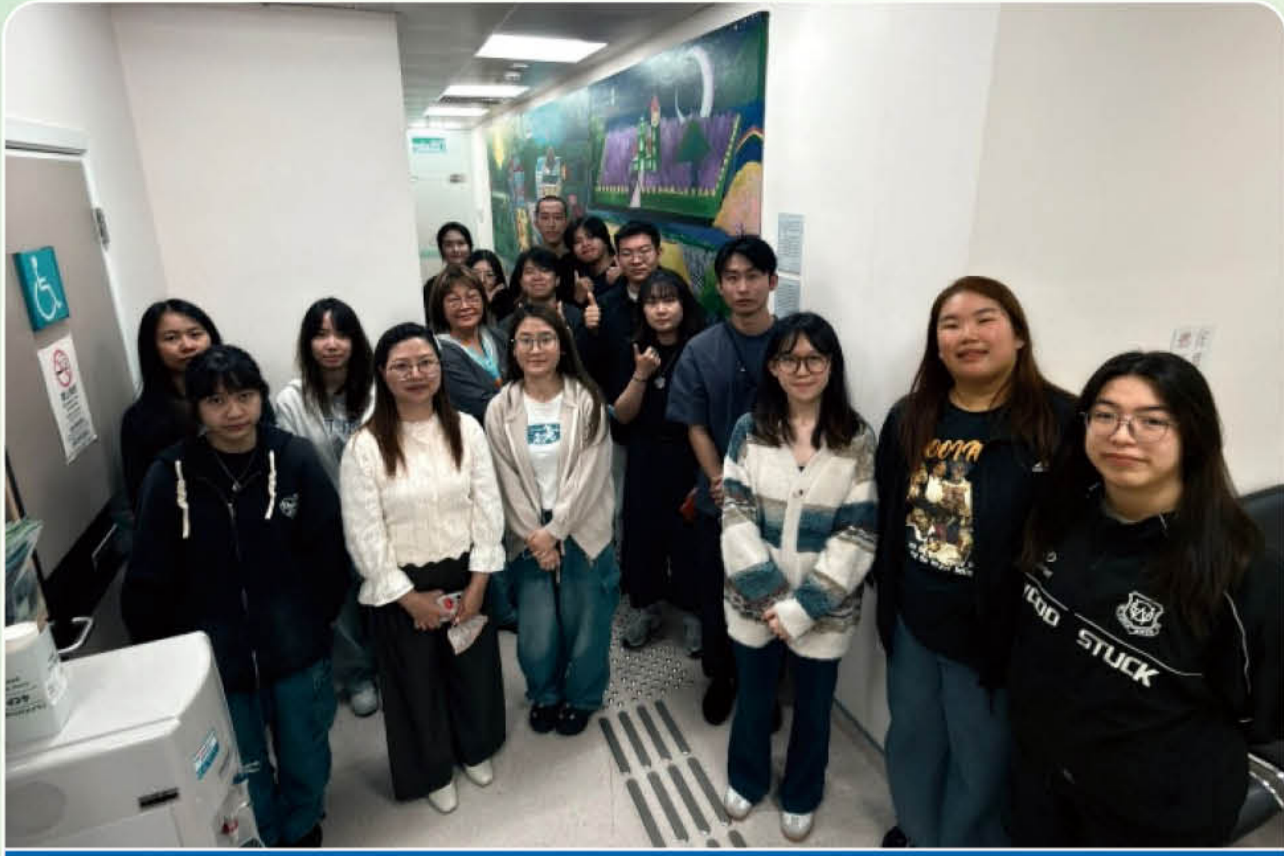
澳門理工大學社工學生參觀美沙酮門診

2026年3月2日澳門理工大學社工系21名師生到訪青洲藥物治療中心，期間由戒毒康復處社工和護士分享本澳禁毒政策和相關法規、國際及本澳禁毒形勢、新活性精神物質、毒品濫用對身體的危害、新興毒品的流行趨勢及應對策略等。隨後參觀青洲藥物治療中心和了解發藥流程，以及講解美沙酮維持治療計劃和清潔針具計劃等，有助學生對毒品和新活性精神物質的副作用、成癮機理及康復服務有更全面的認識。