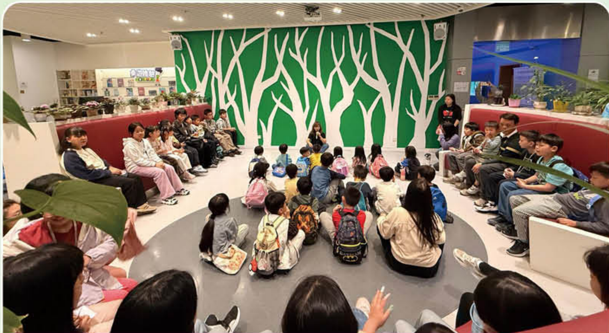
家庭體驗健康生活教育課程

2026年2月21日，澳門學園傳道會組織親子家庭一行50人，前往健康生活教育園地進行參觀體驗。期間，健康生活教育導師引導親子共讀繪本故事《衣櫃的魔法》，並設計以「健康生活」及「安全用藥」為主題的互動遊戲，以及安排家庭體驗健康生活教育課程。活動透過多元互動形式，深化家庭健康教育，有效將預防濫藥的信息融入家庭生活。