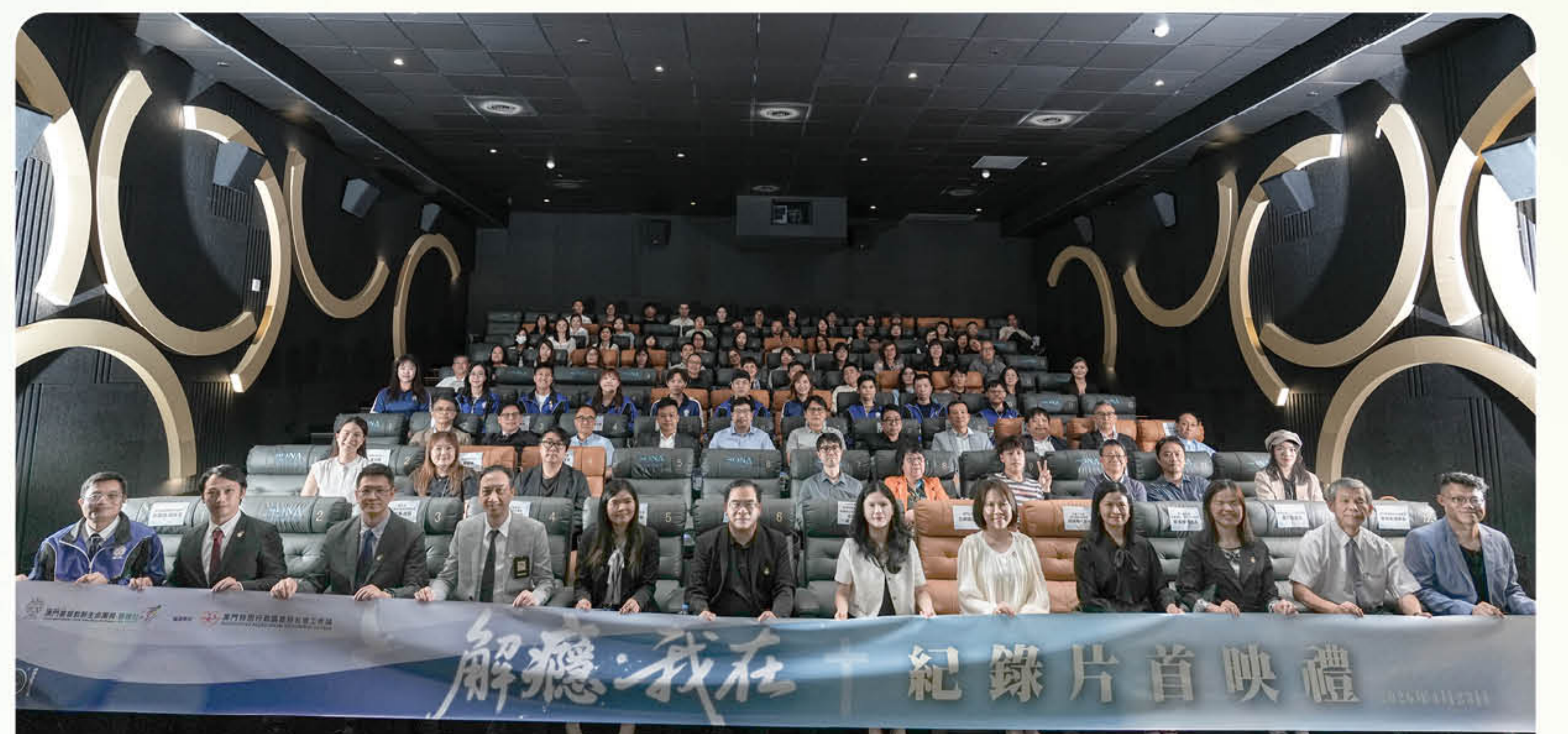
《解癮·我在》首映儀式