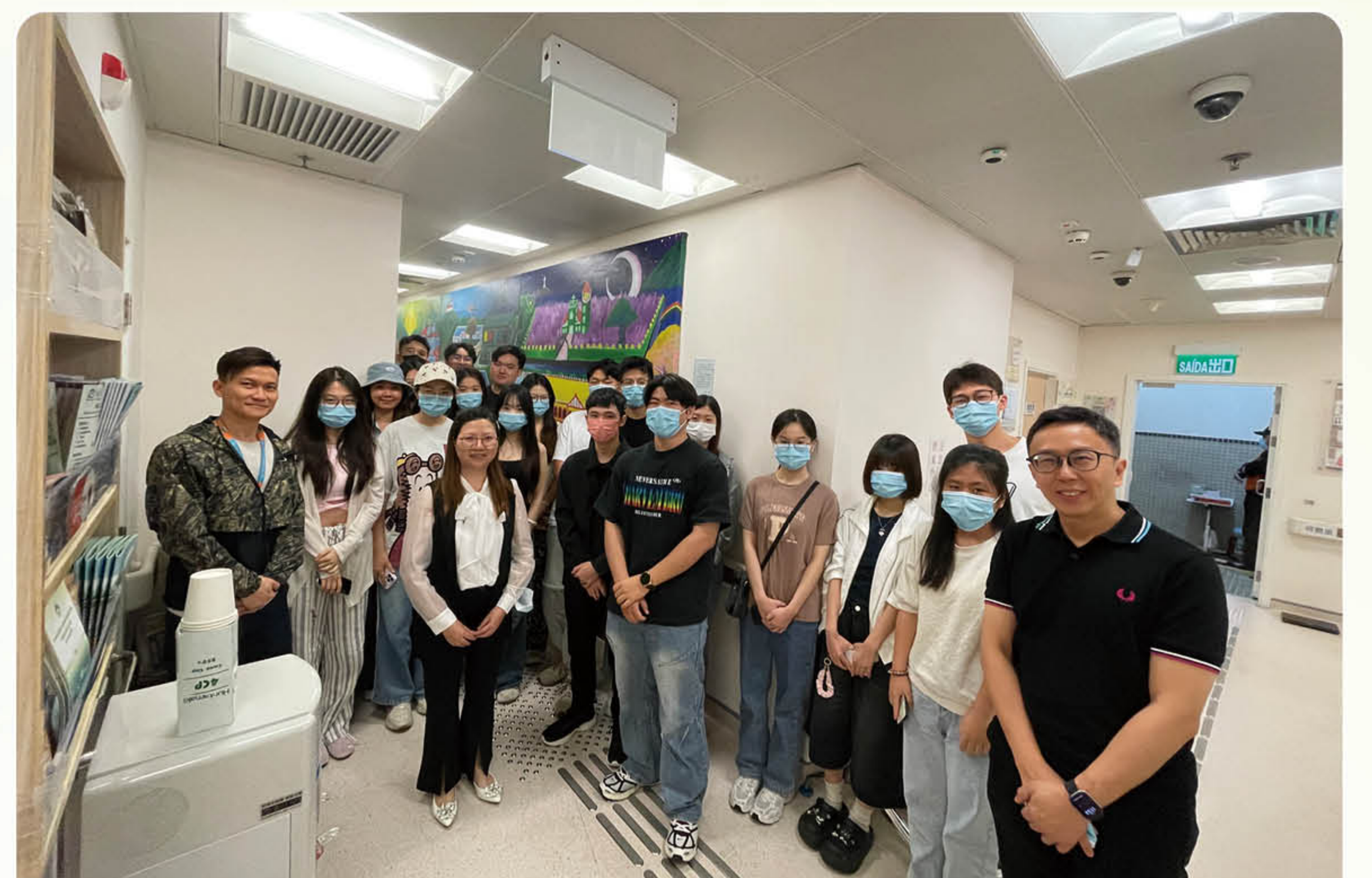
澳門理工大學藥劑系學生參觀藥物治療中心

為了解目前澳門的毒品濫用趨勢，澳門理工大學藥劑系於2026年4月28日組織二十名師生到訪青洲藥物治療中心進行交流及參觀。期間戒毒康復處工作人員和護士分享本澳禁毒政策和相關法規、門診戒癮服務、跨境戒毒服務，司法措施與戒毒治療、新興毒品流行趨勢及應對策略、美沙酮維持治療及社區支援計劃、清潔針具計劃等服務。隨後參觀青洲藥物治療中心和了解美沙酮發藥流程，加深師生對毒品及新興精神活性物質的危害。