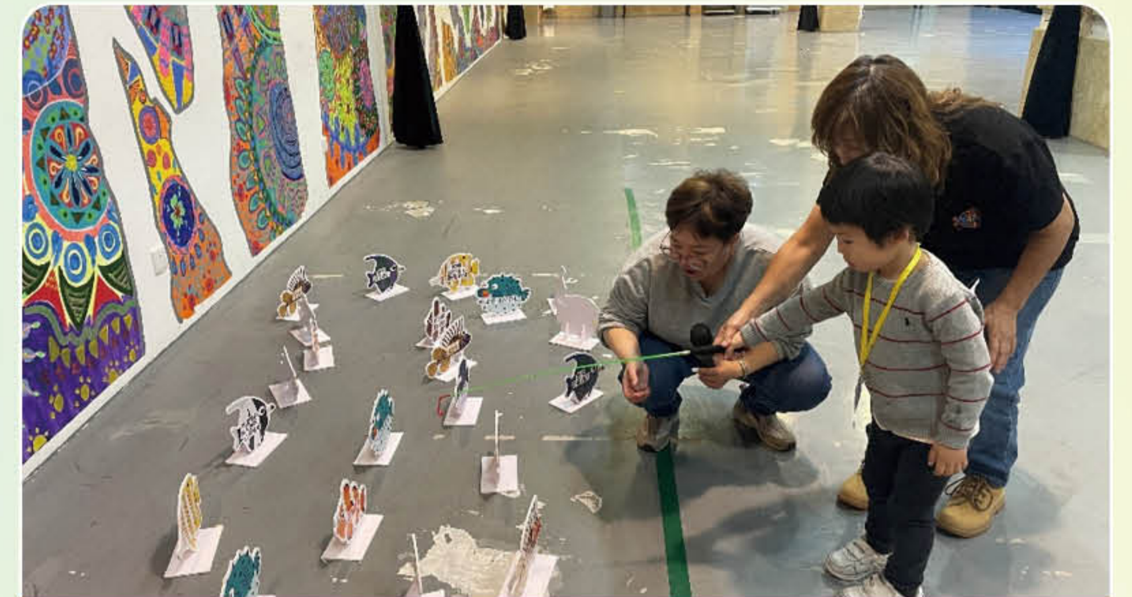
親子參與互動遊戲