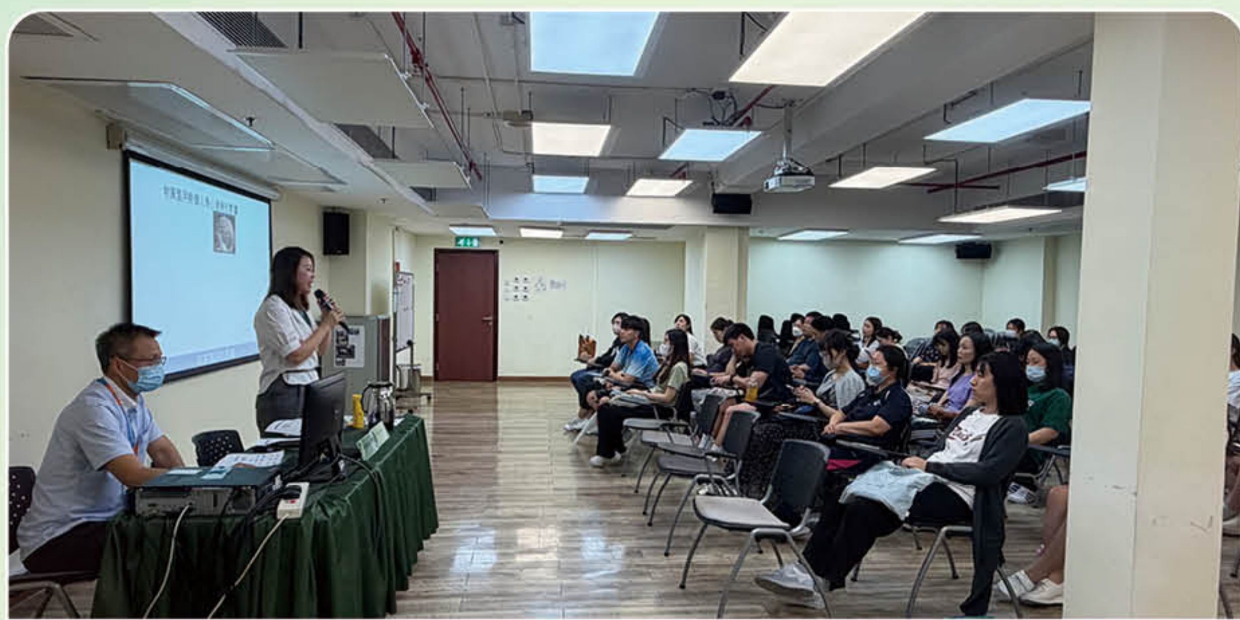
導師分享預防學生成癮問題的輔導介入技巧