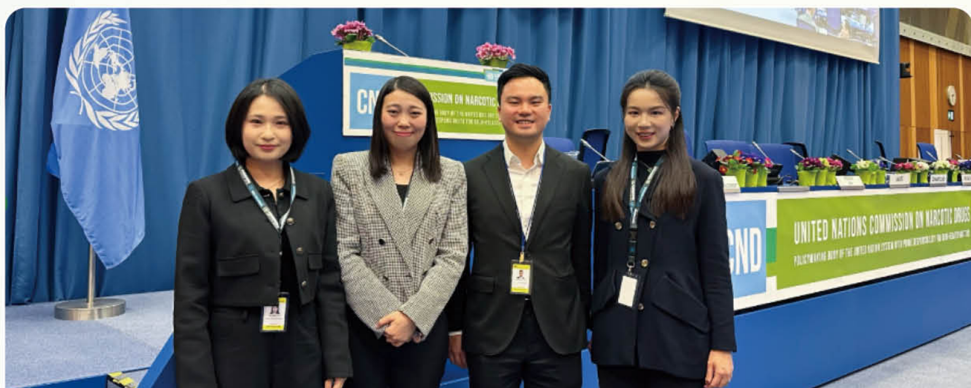
澳門青聯參與第 69 屆聯合國麻醉藥品委員會會議

為配合特區政府推動青年參與國際事務、拓展全球視野，澳門青年聯合會於 2026 年 3 月以聯合國經濟及社會理事會諮商地位首次以觀察員身份參與第 69 屆麻醉藥品委員會，並在參會期間與中外青年雙向交流，積極發揮青年團體橋樑作用。同時，為進一步擴大參會成果、提升社會認知，澳門青聯在會後推出多項宣傳工作，包括圖文包、短視頻，以及於 4 月 30 日舉辦《走進聯合國：第 69 屆 CND 會議分享會》，鼓勵青年拓闊視野，並在國際舞台上講好中國故事、澳門故事。