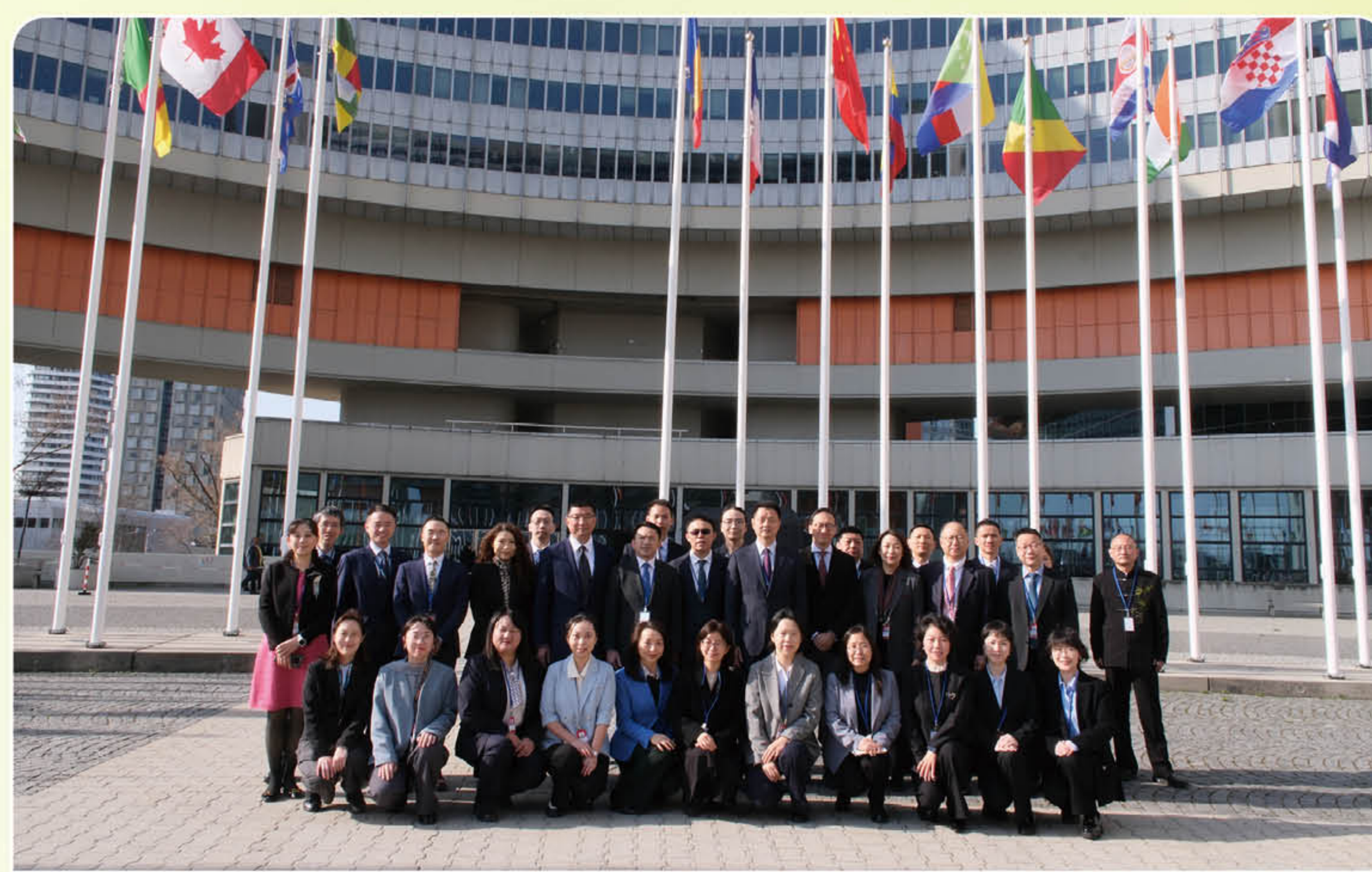
港澳特區代表隨中國代表團參與會議

本屆會議共舉辦超過 160 場邊會和展覽活動，澳門特區代表於全體會議期間以中國代表團成員身份進行發言，並參與多場邊會活動。本屆共有 14 名來自澳門民間機構、青年團體和大學代表參與會議和多個非政府組織邊會活動，並在五場邊會進行專題發言。澳門特區將持續配合國家開展的各項禁毒工作和履行國際公約義務，跟進新列管物質的本地立法工作，同時持續推動本澳民間團體積極發揮力量，共同助力青年在國家與特區發展中發揮所長，在國際舞台講好“中國故事”和“澳門故事”。