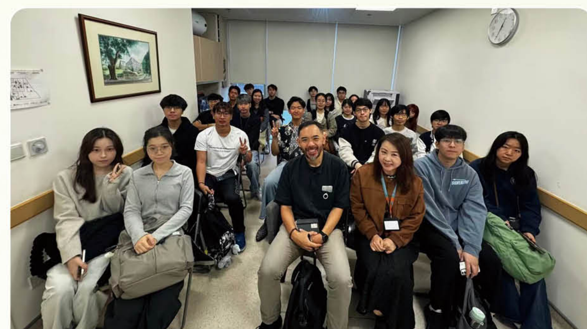
香港中文大學參觀藥物治療中心

2026 年 2 月 28 日香港中文大學人類學系 28 名師生到訪青洲藥物治療中心，並進行參觀及交流。戒毒康復處工作人員分享國際及本澳禁毒趨勢、禁毒政策和相關法規、本澳的戒毒服務，特別就美沙酮維持治療工作、減低傷害工作及戒毒治療服務等方面進行深入討論，隨後參觀本中心設施和親身了解美沙酮維持治療計劃的日常運作，如發藥流程及跟進。當日，學生亦到訪澳門戒毒康復協會 - 外展部及九澳綜合服務中心，了解「握緊希望」職訓實習計劃，全面了解本澳戒毒康復服務在減低傷害，以及外展、職業培訓及綜合服務對戒毒者的支援，此交流強化青年人對禁毒合作及減低傷害工作的認識。