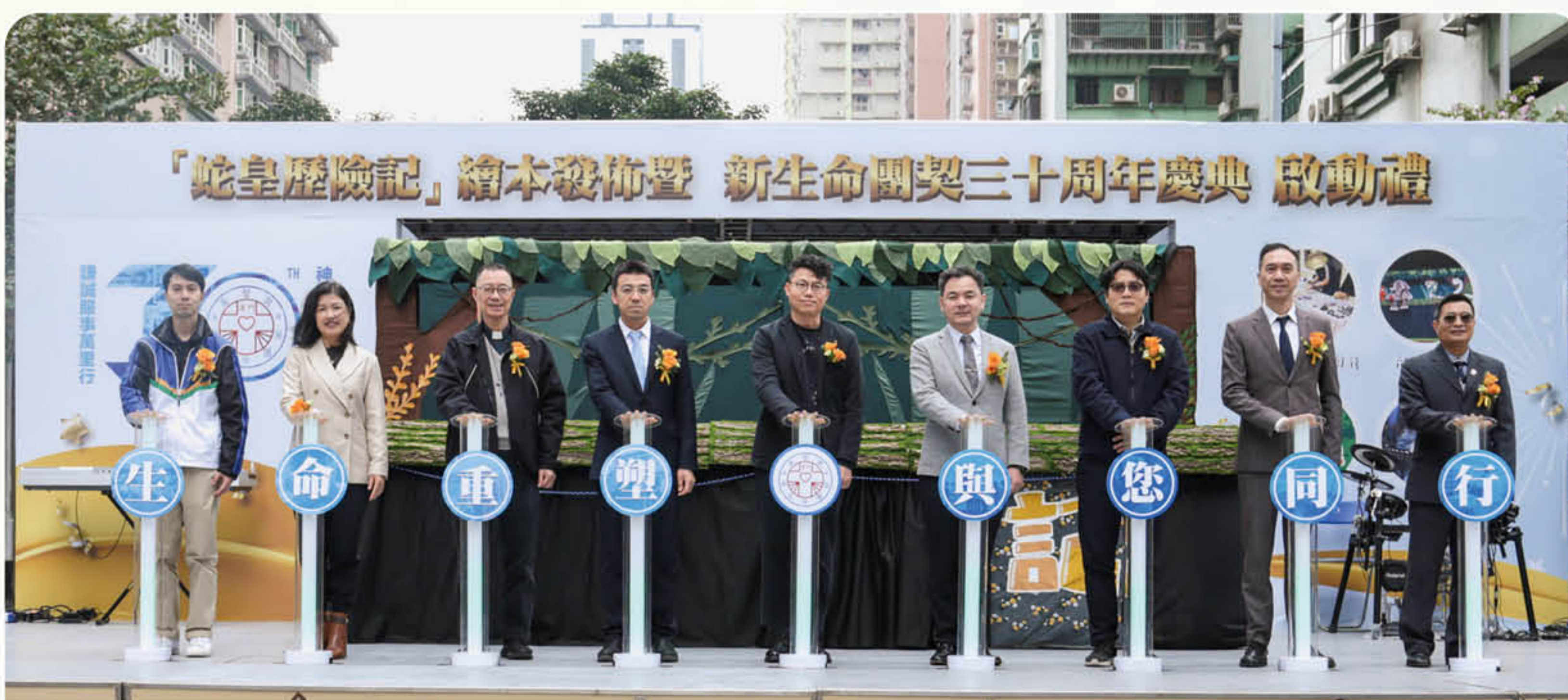
「蛇皇歷險記」繪本發佈會暨新生命團契三十周年 慶典啟動儀式

此外，該會於 4 月 23 日於博納國際影城舉行紀錄片《解癮·我在》首映禮。該紀錄片透過真實記錄成癮者及其家人的生命轉變故事，彰顯本澳戒毒康復服務“同行同在”的精神，以此鼓勵所有身處困境的人士。兩場活動共吸引超過 300 人次參與。