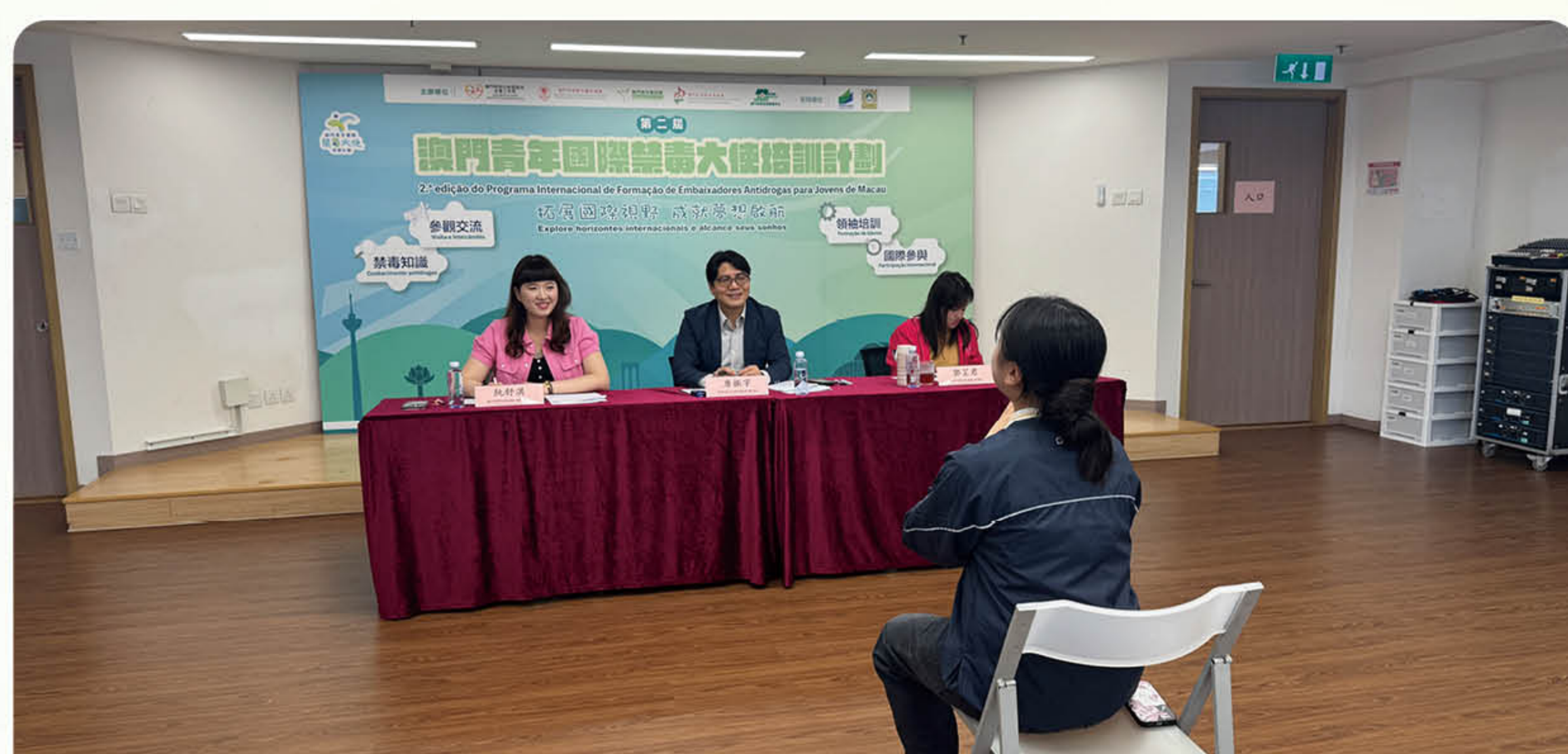
領袖培訓面試工作