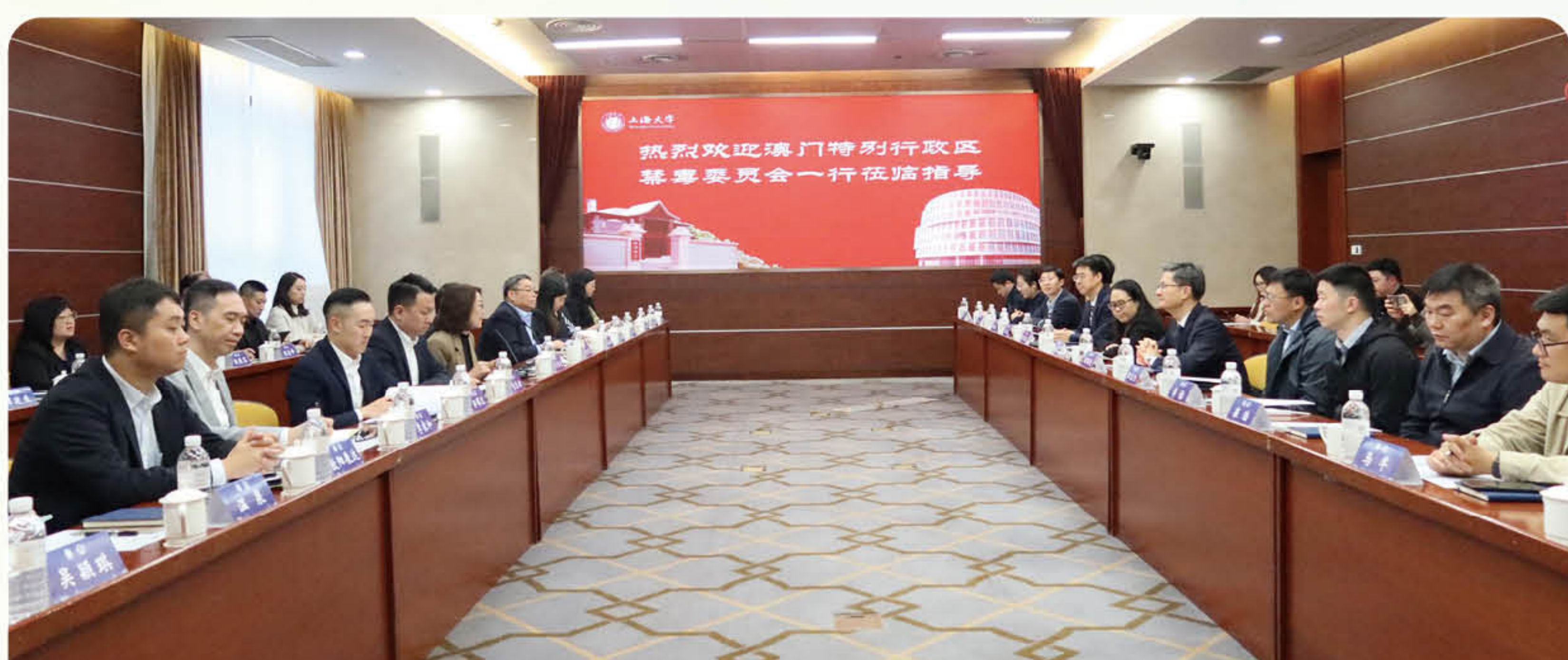
禁毒委員會與上海大學國際禁毒政策研究中心進行專題研討

為促進本澳與內地在防治濫藥領域的合作和交流，澳門特區政府禁毒委員會一行 27 人於 2026 年 4 月 13 日至 17 日期間前往上海，拜訪上海市禁毒委員會辦公室，並考察當地禁毒相關設施期間，與上海市禁毒委員會進行座談交流，雙方明確在防治領域、技術交流及專業發展上加強合作，推動建立兩地常態化交流管道。並與上海大學國際禁毒政策研究中心進行專題研討，就禁毒研究、國際合作，以及在舉辦學術論壇等方面進行深入討論和交流。