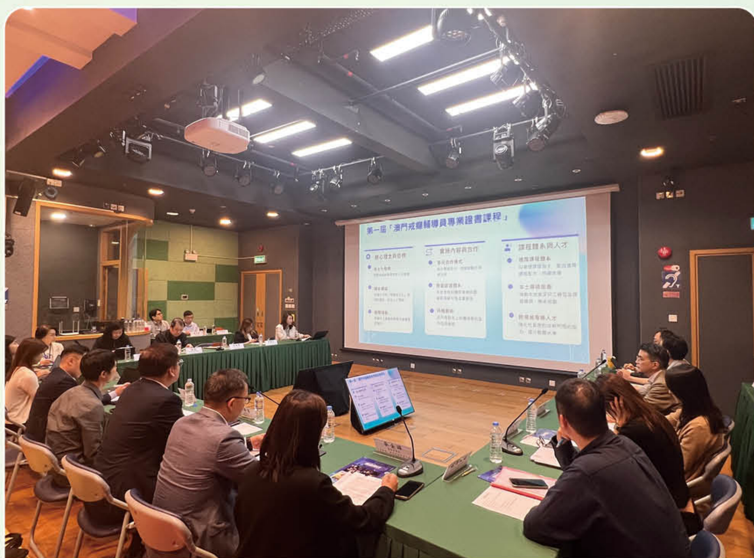
“禁毒法執行及跟進工作小組” 會議情況

禁毒委員會轄下禁毒法執行及跟進工作小組 2026 年度第一次會議於 3 月 25 日舉行。內容包括：報告司法措施轉介個案執行情況及工作計劃、專項計劃執行情況和本年工作計劃、參與第 69 屆聯合國麻委會情況及國際列管物質跟進情況等。小組成員關注禁毒法修法工作，建議持續關注對個案重返社會的支援和跟進工作；加強跨專業轉介和協作，持續提升應對不同成癮行為的能力和專業水平；以及加強禁毒普法的宣傳工作等。