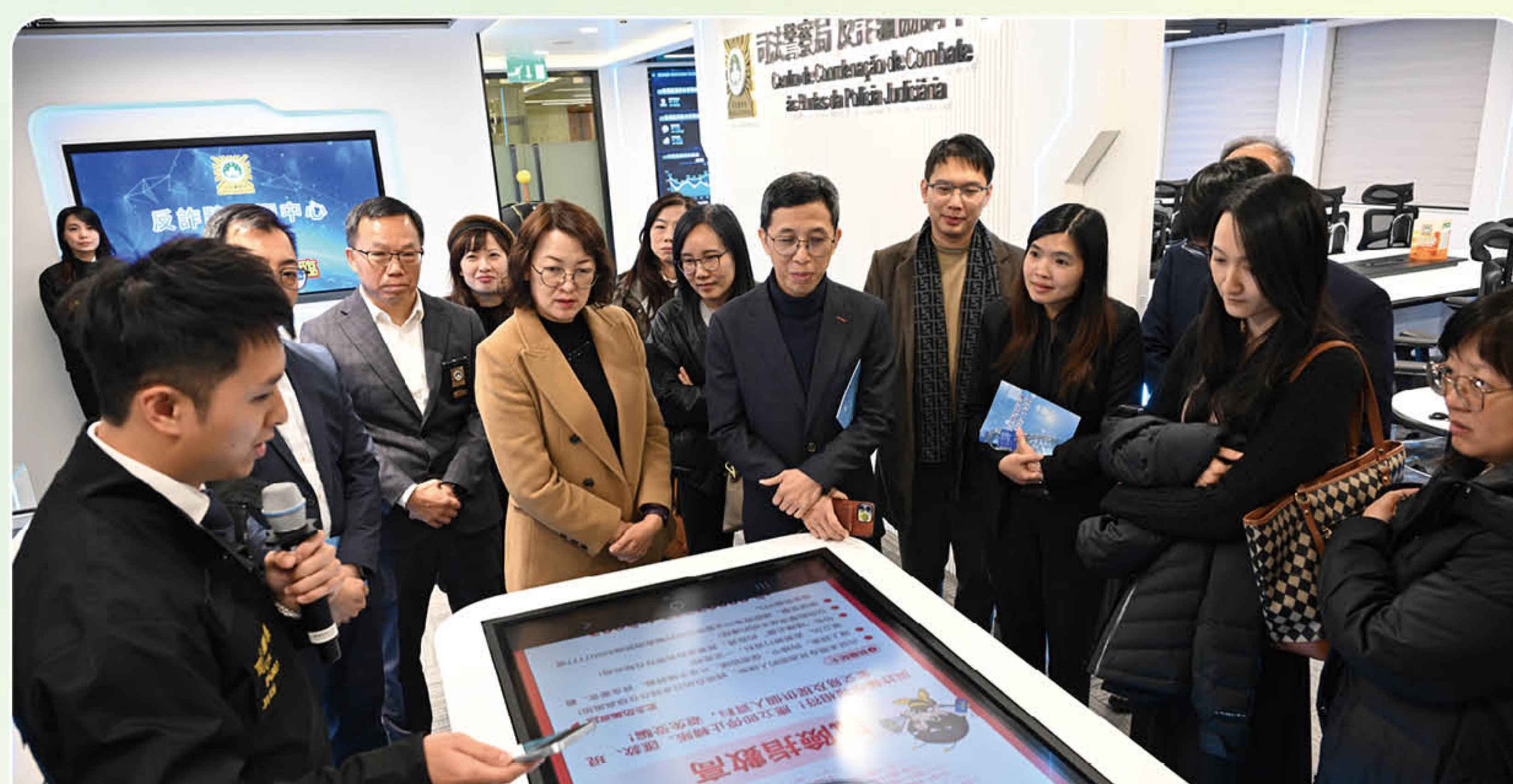
了解反詐騙協調中心、網絡安全事故預警及應急中心運作