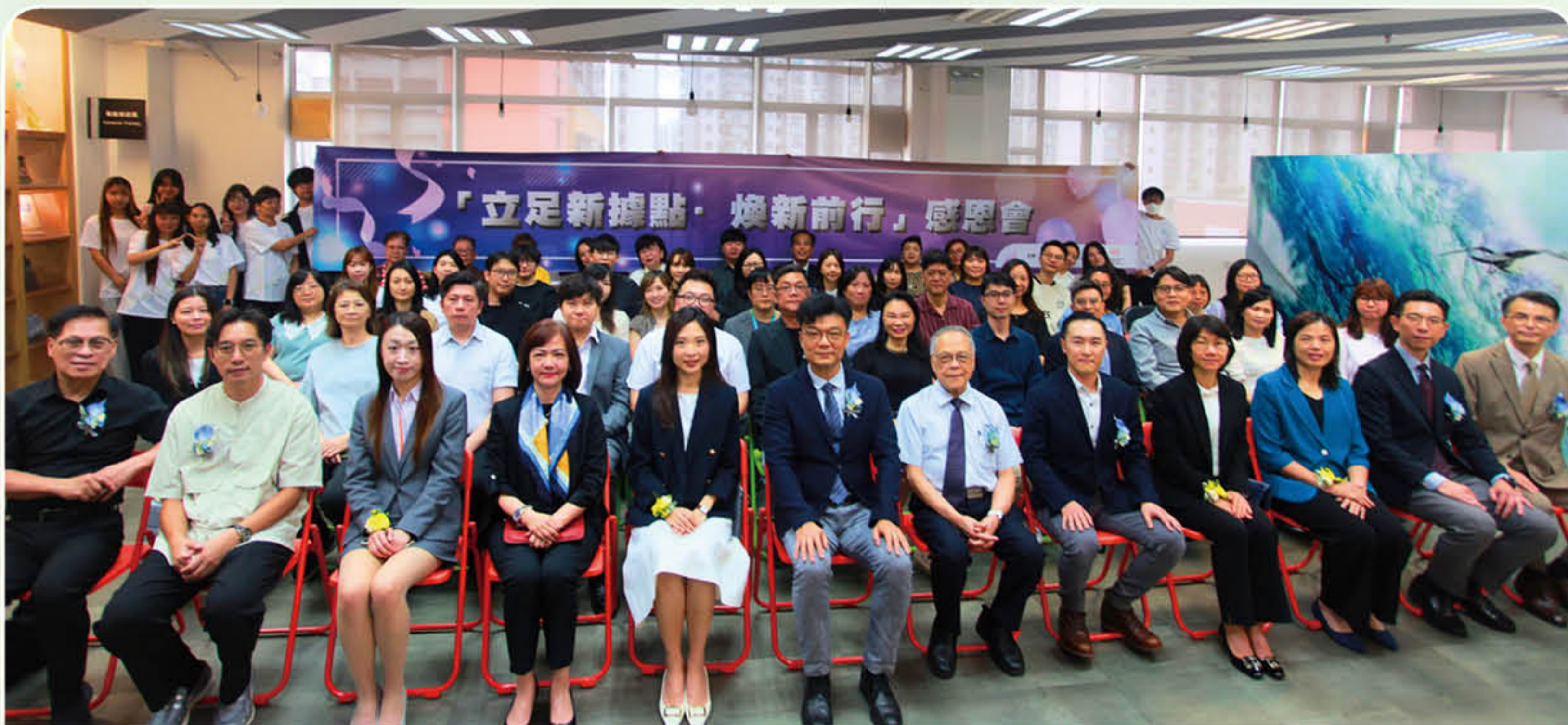
青洲社會服務綜合中心新址啟動禮

此外，中心的文創品牌「逃脫的牛」已於本年2月12日，在大三巴茨林圍設立全新服務據點。該據點依托澳門文創區域優勢，透過舉辦「神奇彩衣」藝術體驗工作坊，充分發展學員藝術創作才華，同時開展社區展覽與文化交流活動，將藝術成果融入本土文化脈絡，推動社會共融，傳承澳門文化。