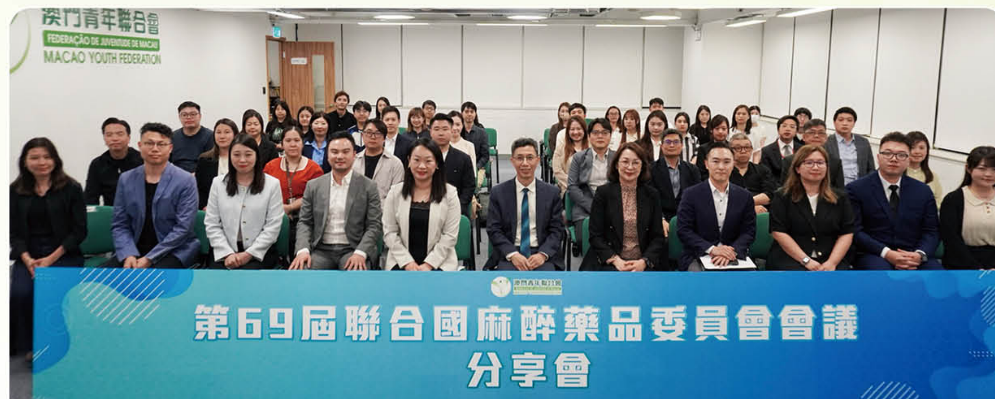
第69屆聯合國麻醉藥品委員會會議 分享會