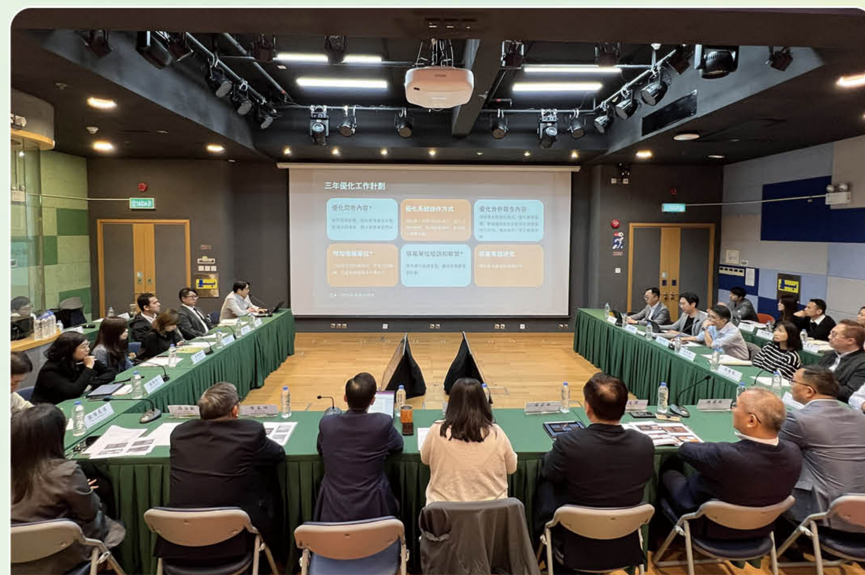
“關注青少年毒品問題工作小組會議” 會議情況

禁毒委員會轄下關注青少年毒品問題工作小組 2026 年度第一次會議於 3 月 18 日舉行。內容包括：2026 年預防藥物濫用工作重點介紹、專題分享「粵港澳大灣區禁毒跨域融合與實務交流計劃」、專項計劃執行情況和本年工作計劃等。小組成員建議持續關注青年培養和重返工作，積極面向家庭、海外留學青年開展宣傳教育，促進本澳與內地建立個案協作機制，並持續發揮小組資源優勢拓展多元預防濫藥工作。