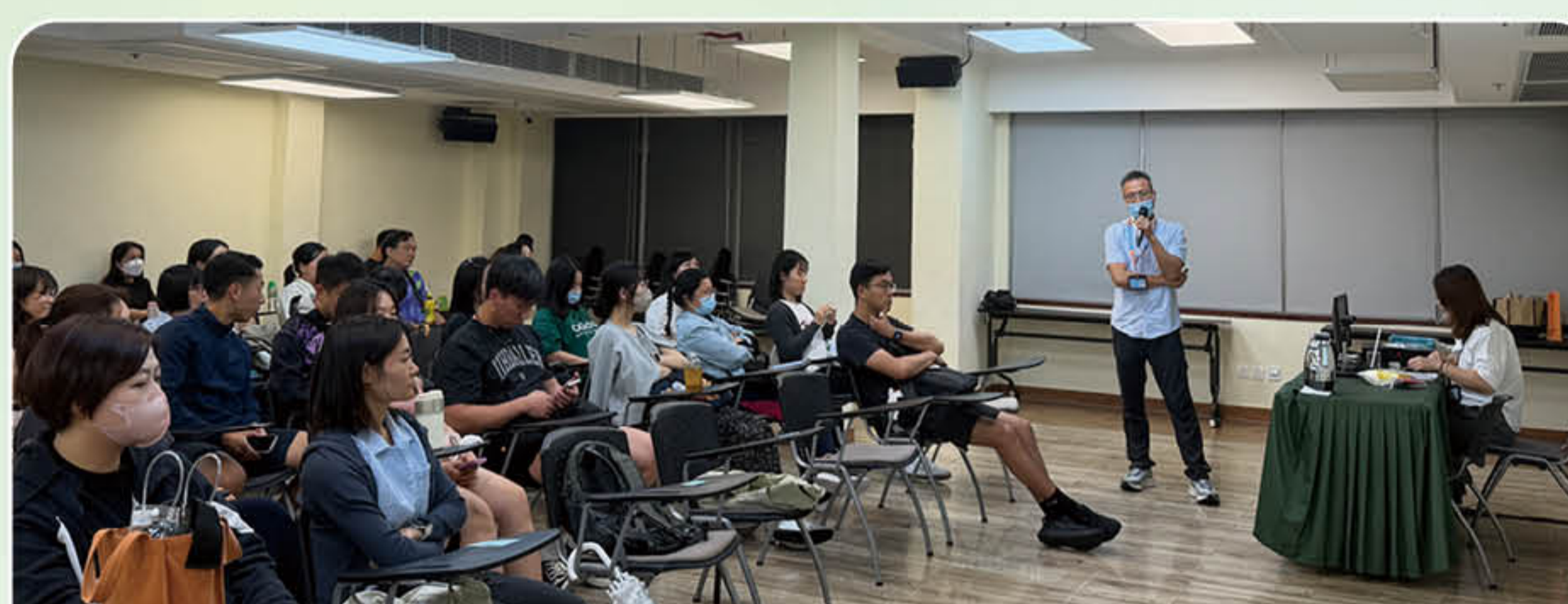
導師分享酒精和吸煙的禍害

為配合澳門特區政府《控煙法》及《控酒法》的實施，社會工作局與教育及青年發展局合作於 2026 年 3 月 17 日及 4 月 24 日舉行兩場『預防學生的成癮問題』培訓，共有 97 名中小學教學人員參與。是次培訓內容為優化教學人員辨別學生相關成癮行為的知識及輔導介入技巧，針對吸煙和飲酒對身體帶來的危害，以及電子煙、長期飲酒引發的濫藥危機等，並介紹有關全球毒品趨勢及本澳禁毒政策，澳門地區戒癮相關服務和資源，藉此提升本澳教學人員對預防成癮教育的重視，鼓勵問題學生及早接受戒癮治療，以維護學生身心健康的發展。