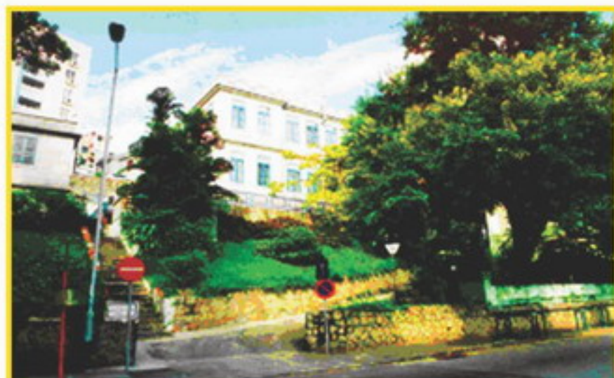
戒毒綜合服務中心 加思欄後新馬路

社工局編號 DTRS/IAS/C - PAN003 - 10.2005 - 5,000 exs.