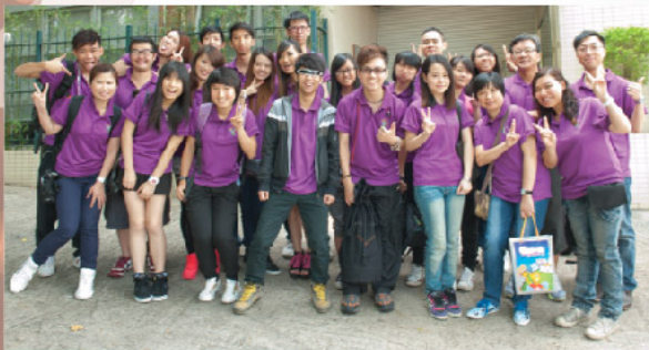
圖五：到訪香港參觀基督教服務處賽馬會日出山莊