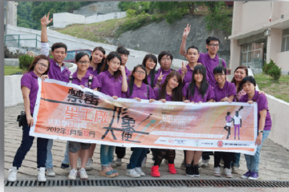
圖四：學員在澳門青年挑戰綜合培訓中心參觀後留影