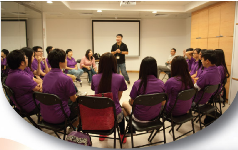
圖三：澳門基督教新生命團契SY部落 社工向學員介紹澳門的禁毒外展工作