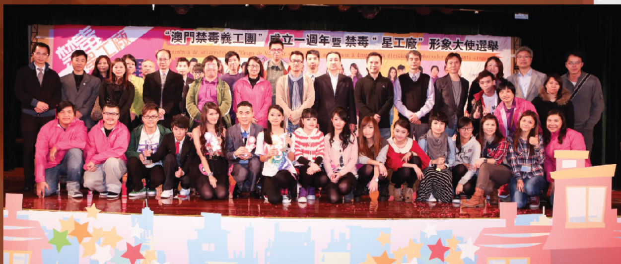
圖五：參賽者與嘉賓及工作人員大合照

來年，禁毒形象大使大獎得主及“星工廠”一班青年禁毒義工們，將繼續關注毒品問題，集合禁毒形象大使的力量，積極向社區宣揚禁毒訊息。